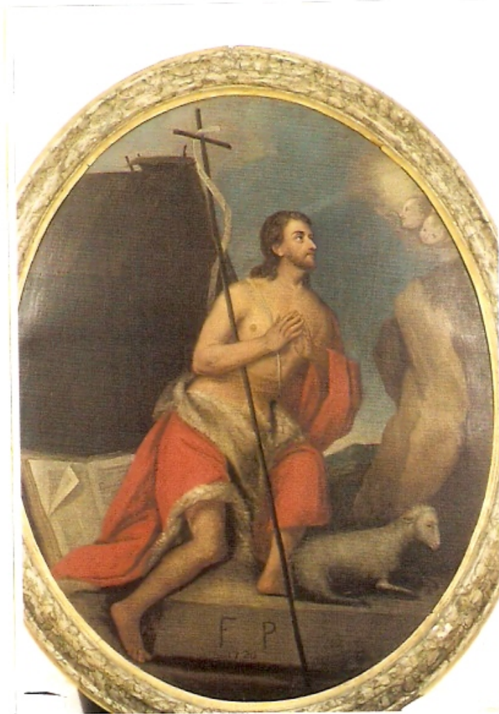
L'opera prima della manutenzione

Emanuela Scaravelli Conservazione e restauro