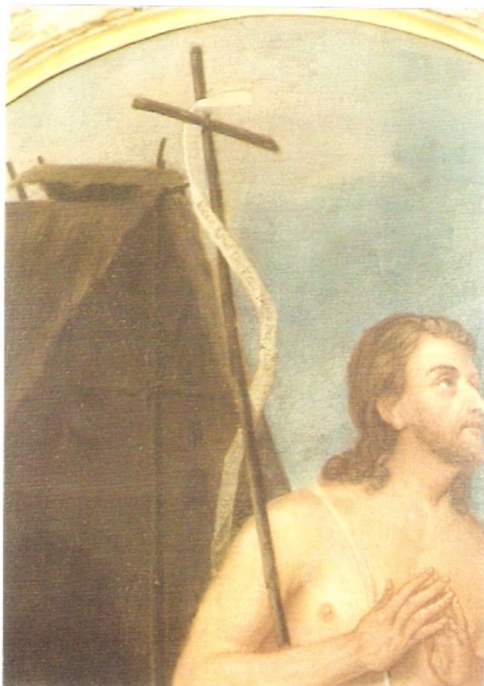
L'opera dopo la manutenzione

Emanuela Scaravelli Conservazione e restauro